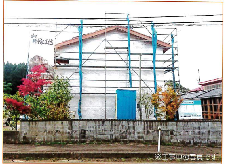
※工事中の写真です

建物はやっぱり構造が一番大切だと思います。 地震や強風時に大切な家族や家財を守り 冬場の煩わしい雪下ろしの手間をなくしたい そんな思いから『剛家工法』をご提案させて 頂いています。完成すると見えなくなってしまう 柱のたくさん入った構造をぜひ一度ご覧になって下さい。